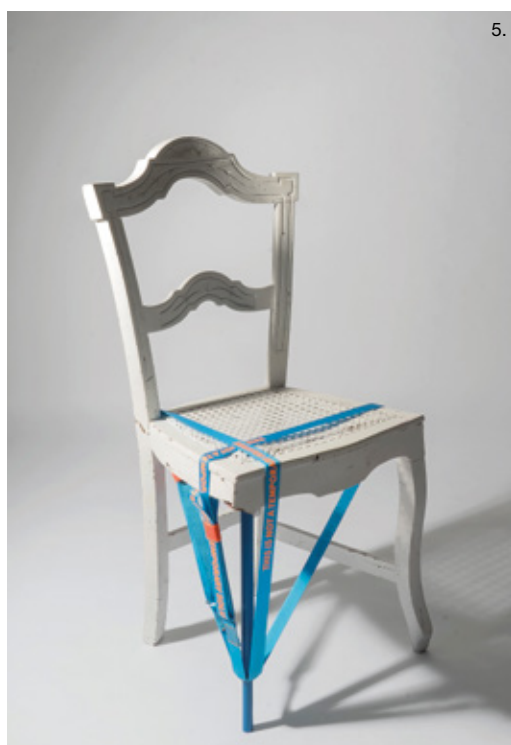
4. HABITAT, Andrea Maresch 5. VELT, Laia Lloret